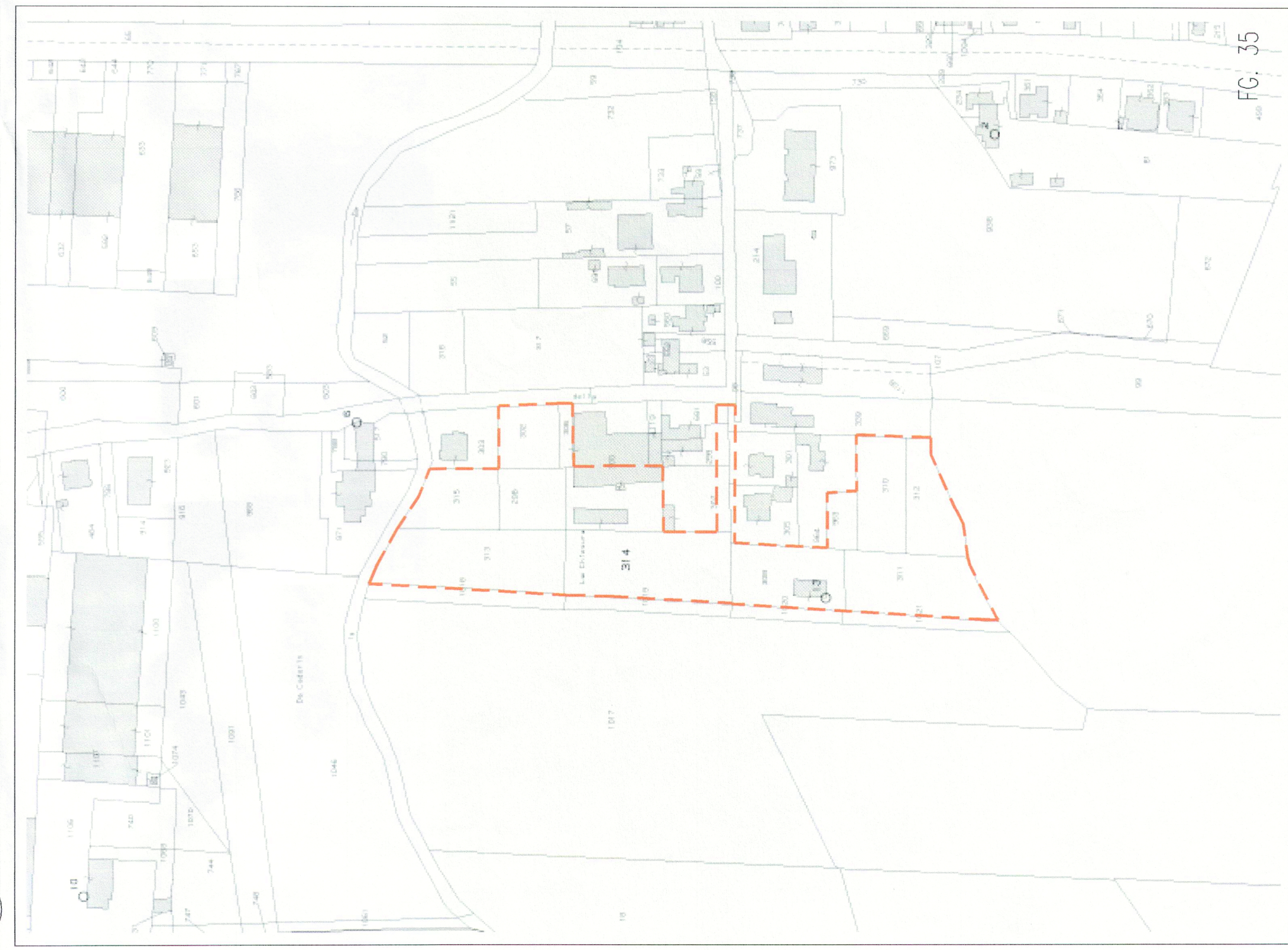
4 ESTRATTO MAPPA CON INDIVIDUAZIONE AMBITO C2/33 1.2000